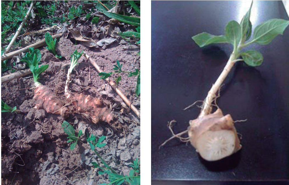
Foto 1. Tubérculos brotados durante la conservación a campo.