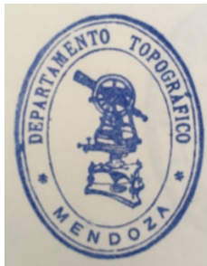
Imagen n°1: Sello oficial del Departamento Topográficos utilizado en la década de 1870 y 1880

Siguiendo esa línea, la imagen que se presenta a continuación (Imagen n°1) es la del sello oficial del Departamento Topográfico, el cual se imprimió en todos los documentos elaborados, por esa oficina, durante las décadas de 1870 y 1880. Su relevancia tiene que ver, en primer lugar, con la intención de individualizar al Departamento Topográfico dentro de la trama de instituciones del gobierno del momento. A través del sello, el Departamento marcaba su terreno de acción. En segundo lugar, y vinculado con la intención de ilustrar el ser una oficina técnica, la imagen muestra un teodolito, instrumento cuya utilización requiere de un saber no accesible a cualquier persona.