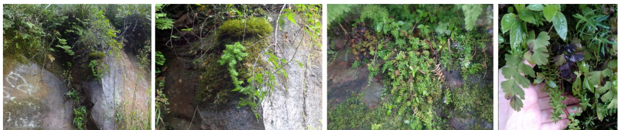
Figura 1. Sedum jujuyense en su sitio de origen.

Al continuar el ascenso por la Quebrada de Yala hasta los 2100 m.s.m. no se volvieron a encontrar ejemplares de Sedum , lo que evidencia su distribución restringida.