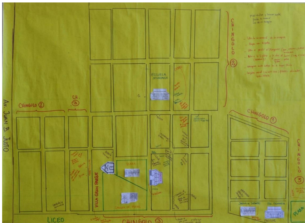
Imagen 2 (Taller “Recorridos para la obtención y compra de alimentos/comidas”)

tienen una gran disponibilidad de negocios en cuanto a variedad y cercanía (el kiosco, la verdulería, panadería, pollería o el almacén)(Imagen 2); mientras que fuera del barrio realizan compras más grandes en “supermercados chinos o hipermercados”, “ferniplast” (polirubro local) dónde encuentran “precios más bajos e incluso ofertas”, quedando condicionadas a las posibilidades de desplazamientos –largas distancias- o a los recursos económicos –cuando cobran- (Imagen 3). En concordancia con algunas autoras cordobesas, las gramáticas del espacio definidos por la política de hábitat delimita un anclaje territorial para las (im)posibilidades de circulación cotidiana y desplazamientos para comer (Ibáñez, Huergo, 2015).