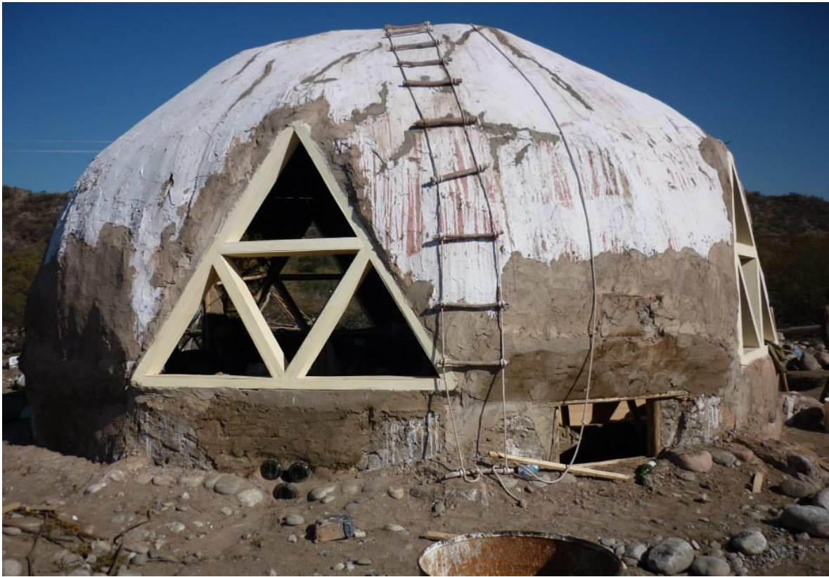
Bioconstruccion en San Carlos: