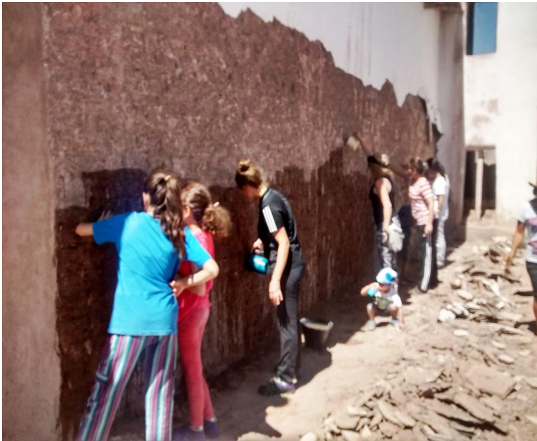
Foto: Revoque con barro en San José. Lavalle. Mendoza