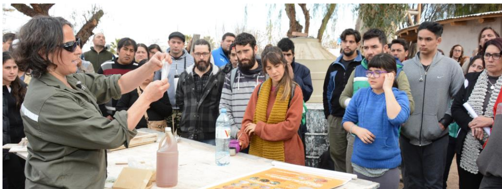
Foto: Taller de vivienda en quincha mejorada. Lavalle. Mendoza

Para concluir, tener presente la propuesta de la Producción Social del Hábitat desde el Trabajo Social, podría de alguna manera ofrecer una respuesta al problema habitacional en las zonas rurales, y a través del conocimiento sobre desarrollo sustentable, la construcción de domos geodésicos sería una opción viable, no sólo porque el costo de los materiales se reduciría considerablemente, sino que, también cumpliría con el propósito de proteger al medio ambiente, cuya problemática compromete a toda la población, además se adapta a los usos, costumbres, cultura, necesidades, etc. de los lugareños, contando siempre con la asesoría técnica integral pertinente y con los recursos económicos necesarios. Esta modalidad privilegia la cohesión social gracias al trabajo en conjunto con los miembros de una comunidad haciendo uso de las capacidades de cada uno, logrando con esto un tejido social fortalecido con los esfuerzos orientados hacia un hábitat sustentable.