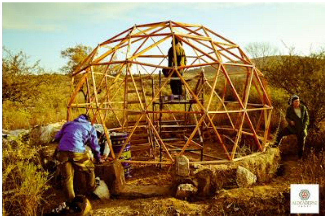
Foto: Aldea de Paz Tanti. Tanti. Córdoba. Argentina