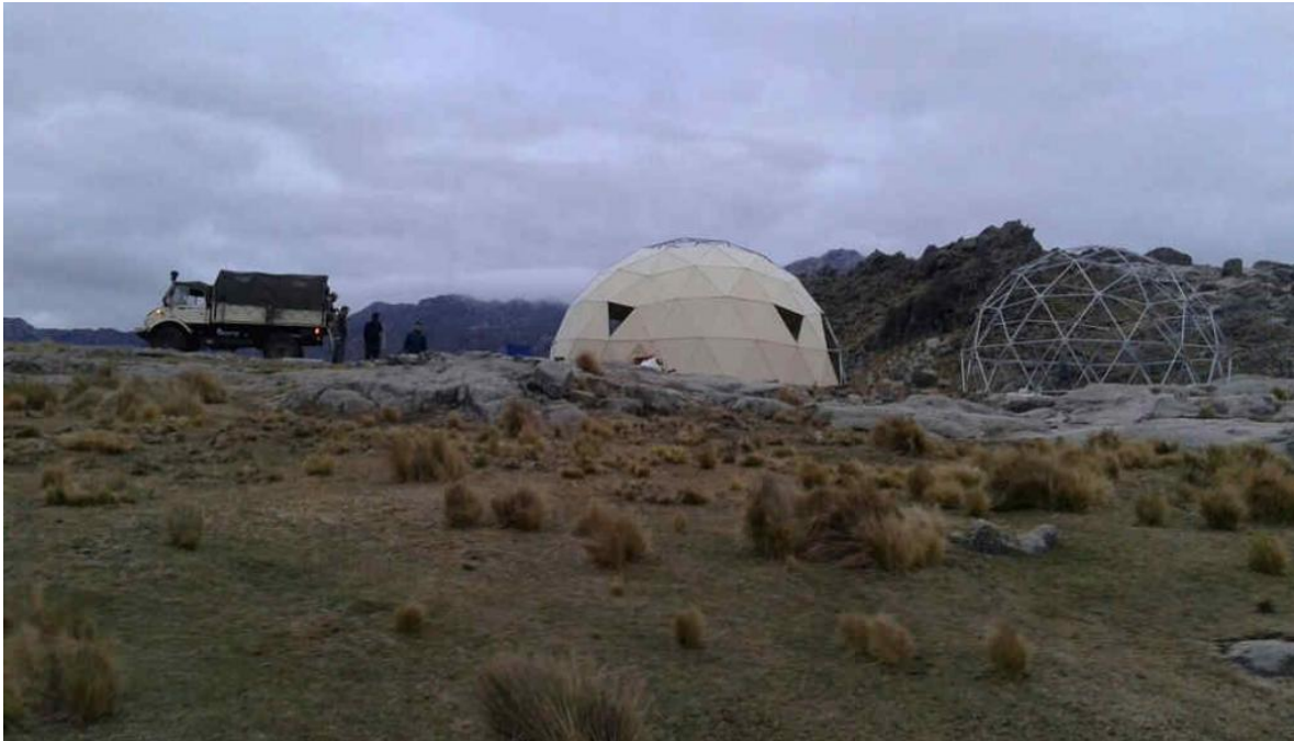
Bioconstruccion en Bahía Blanca: