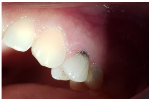
Fig. 1. Foto clínica inicial.

Al examen clínico se observó obturación con resina mesio oclusal del elemento 24, con cambio de coloración en cervical. Los tejidos blandos se encontraban con inflamación, sangrado con presencia de bolsa periodontal de aproximadamente 10 mm ( Fig. 1. ).