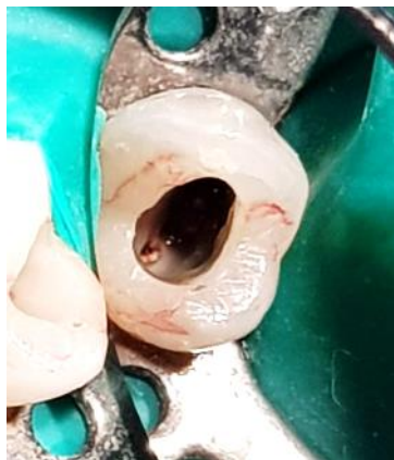
Fig. 3. Fotografía de apertura cameral.

Se decide realizar la apertura coronal para visualizar la zona de la lesión; se realizó anestesia infiltrativa (articaina clorhidrato al 4%-L-Adrenalina 1:100000, solución inyectable de laboratorio Bernabó), se retiró la obturación de resina de elemento 24 con piedra de diamante redonda número 4 a alta velocidad con irrigación acuosa, luego se realizó el aislamiento de la pieza dentaria con goma dique, al llegar a la cámara pulpar se encontró un material que no se pudo determinar cuál era, el mismo intentaba sellar una perforación mesio vestibular en la zona cervical del cuello dentario, se decide lavar con clorhexidina al 2 % (Tedequim ® ) y limpiar la zona, al observar que la perforación es de gran tamaño se toma la decisión de abordarlo vía quirúrgica en una sesión posterior ( Fig. 3. ).