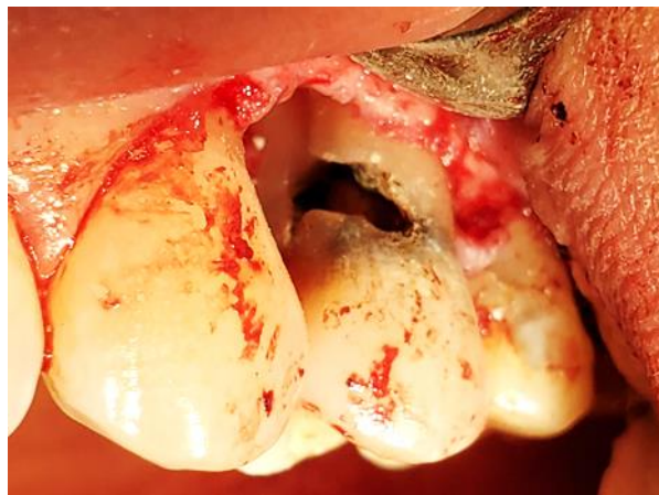
Fig. 4. Imagen de la perforación descubierta en su totalidad.

En la cita siguiente se realiza el tratamiento quirúrgico en el cual se realiza la antisepsia del campo operatorio, se coloca anestesia infiltrativa (articaina clorhidrato al 4%-L-Adrenalina 1:100000, solución inyectable de laboratorio Bernabó) y se decide un colgajo a través del surco gingival utilizando una hoja de bisturí N° 15 C; se utiliza un decolador de Molt para el desprendimiento del tejido, se lava con solución fisiológica y utilizamos ultrasonido con un injerto de punta redonda y constante irrigación con solución fisiológica, lo cual descubre la perforación en su totalidad ( Fig. 4. ).