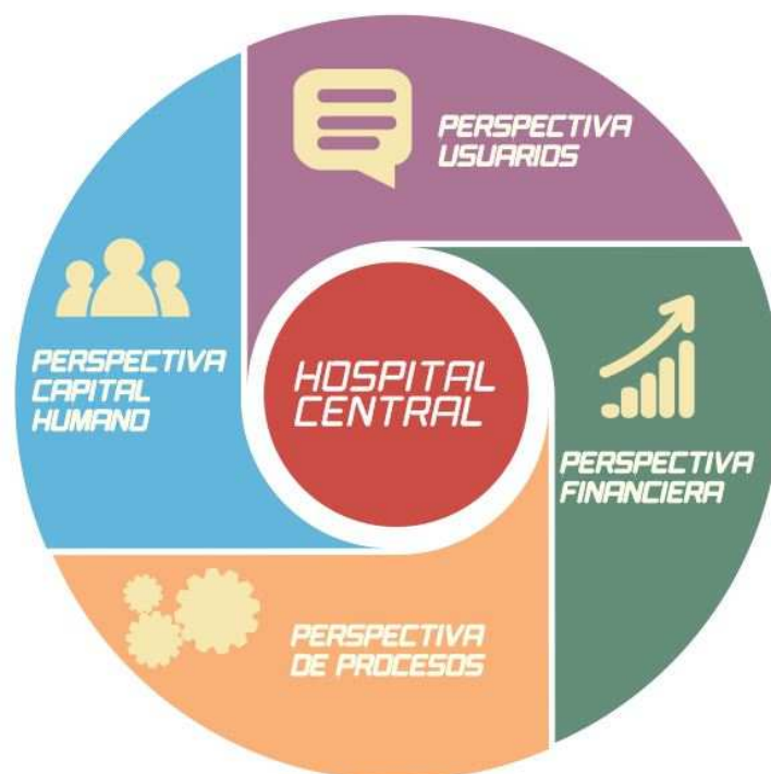
Figura N°3: Perspectivas estratégicas.