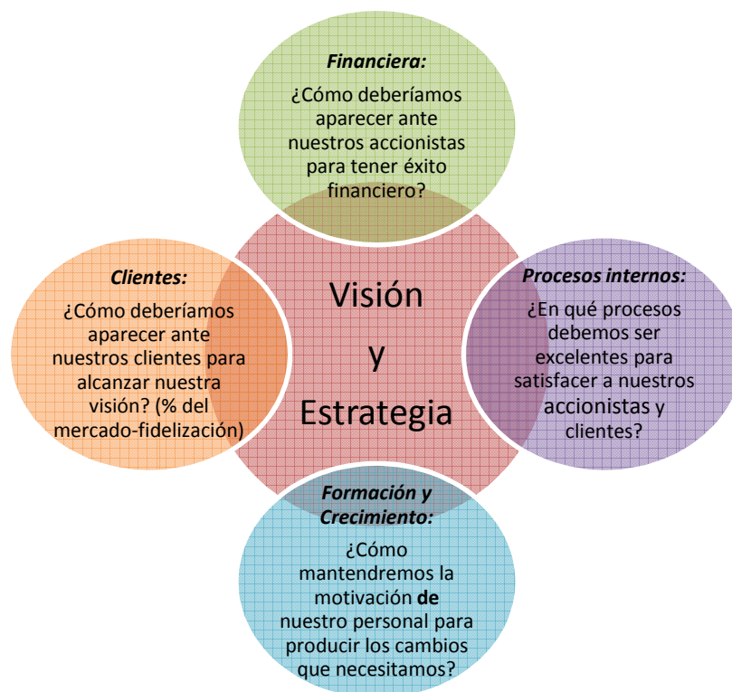
Figura 1. JARDEL, Eduardo M. “Tablero de Control – Cuadro de Mando Integral”

Esto significa que gracias al trabajo en Aprendizaje de personal los procesos internos se realizan con mayor calidad. Esto, a su vez, da como resultado clientes más satisfechos los cuales mejorarán el rendimiento financiero a largo plazo.